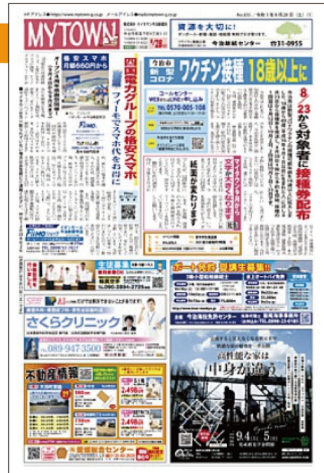
※2020年マイタウン調べ