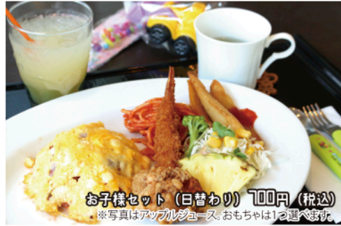
お子様セット(日替わり)700円(税込)

ゆらりのメニューは、1食で15~20種類の野菜を食べることができ、料理はすべて身体に優しい無添加のものを使用。大人用のお子様ランチ「大人様ランチ」もオススメです☆