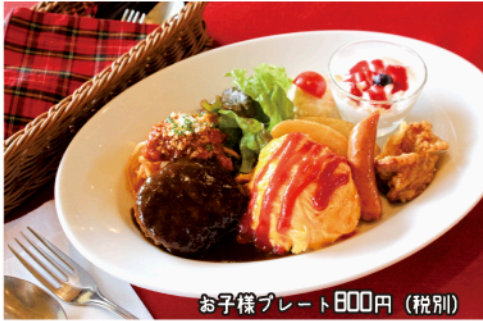
お子様プレート800円(税別)

石窯で焼くピッツアなどのイタリアンをはじめ、昔ながらの洋食も充実。お子さん連れも安心な座敷の個室は、最大20名までOKなのでママ会にもオススメです☆