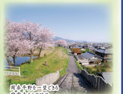
周桑平野を一望できる 興雲寺からの眺め