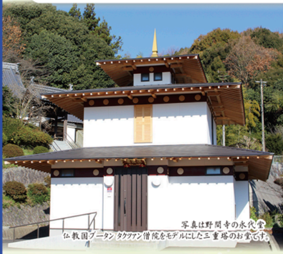
写真は野間寺の永代堂 仏教国造・タクワン僧院をモデルにした三重塔のお堂です。