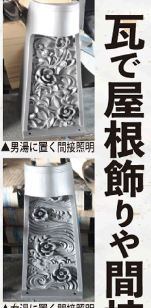
▲男湯に置く間接照明 ▲女湯に置く間接照明