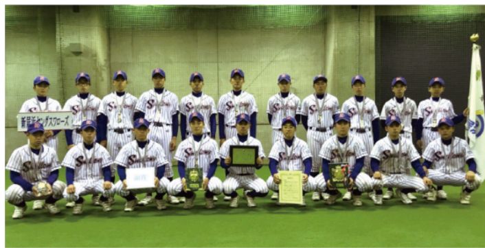
▲全国大会で準優勝した新居浜ヤングスワローズの選手ら