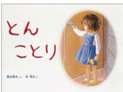
『とんことり』 作/筒井 頼子 絵/林 明子 出版社/福音館書店

別子銅山記念図書館の司書です。子どもたちに読書の楽しさを伝えるため、読み聞かせなどを行っています。