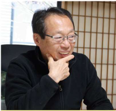
「行政との連携も必要。ネットワークを築きたい」