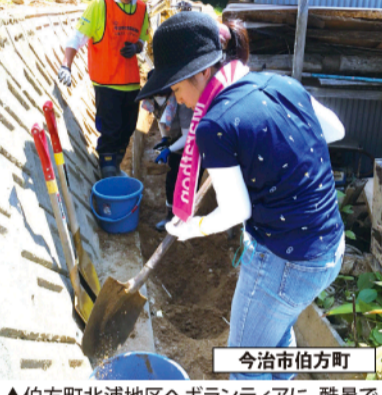
▲伯方町北浦地区へボランティアに、酷暑で作業を始め数分で全身汗ぐっしょりに

ティアに参加した。愛らんど今治(南宝来町)へ朝9時迄に集合し、その後出発式を行った。熱中症に対する注意事項などを聞いた後、新居浜や松山、遠く 作業を始めて数分、汗で全身ぐっしょり 作業数分で汗だく乾いた土砂まるで石 7月16日(月)、休日は東京や千葉からのみを利用してボランティア学生さんらも参加した。思い出の詰まった家々が、土砂の乾いた塊にかき消された。現地には10時過ぎに到着。二手に分かれて土砂を取り除く作業に入った。家の裏手の細い水路は、土砂や石でつまっていた状態。次に雨が降った時に甚大な被害が予想されるため、重機も入らない場所の土砂は全て手作業。16時には全ての作業が終了。住民の方から「今日は暑い中来て頂きありがとうございます」との感謝の言葉に、私も胸が熱くなった。一刻も早く、元の生活に戻ってほしいと祈った。