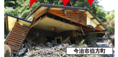
▲「家からすぐ近くの景色が全て変わった」と口を揃えて話す住民ら

今治市伯方町 メディアの報道が少 ない地域は、まだまだ 助けを必要としている 方が沢山いる。連休が 終わり、ボランティアの 数も激減したという ニュースも聞く。現地 に入り体感しなければ 現実とは分からない。 今回土砂崩れが起 こった所は防災マップ