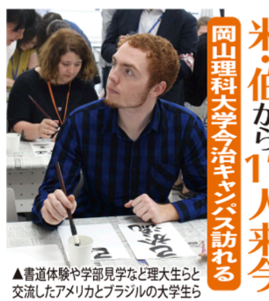
▲書道体験や学部見学など理大生らと交流したアメリカとブラジルの大学生ら

加計学園(岡山市)は毎年、恒例のアメリカ・ブラジル訪日文化研修団の受入れを先頭に行い、両国から計17人の大学生が、岡山理科大学を訪れました。岡山キャンパスでは、理大生らに弓道や剣道を教えてもらったほか、様々な交流を行いました。今治キャンパスでは、理大生らと学食で日本食を味わっ