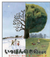
『いっぽんの木のそばで』 作/G. プライアン・カラス 訳/いしづちひろ 出版社/BL出版