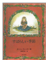
『すばらしい季節』 作/ターシャ・テューダー 訳/末盛千枝子 出版社/現代企画室

別子銅山記念図書館の司書です。子どもたちに読書の楽しさを伝えるため、読み聞かせなどを行っています。