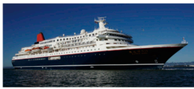
▲岸壁沿いでイベント開催は17年ぶり

無事、資格を取得でき「協力してくれた皆さんのおかげ。ありがとうございます。ありがとうございます」と話します。