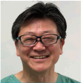
インプラント治療のトップリーダー