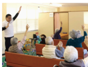
▲心身療法指導士と一緒に心身体操をしている様子

自然豊かな伯方島で「心身共に健康な体づくりをサポートする」を理念にかかげ、患者さんの症状・体質・性別に合わせて、西洋医学と東洋医学を組み合わせた治療を行っています。 漢方は副作用も少なく