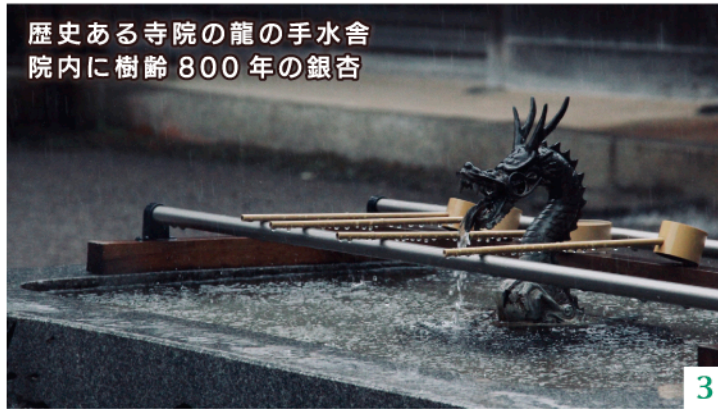
歴史ある寺院の龍の手水舎 院内に樹齢800年の銀杏