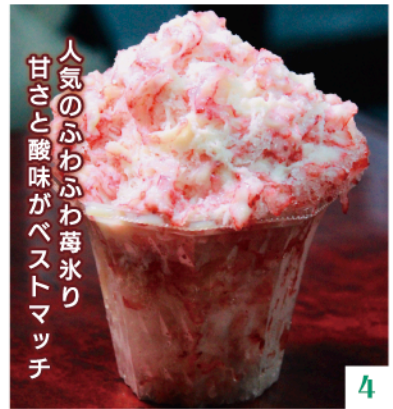
人気のふわふわ苺氷り 甘さと酸味がベストマッチ