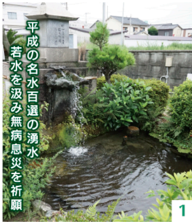
平成の名水百選の湧水 若水を汲み無病息災を祈願