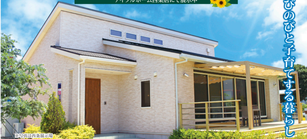
※写真は西条展示場