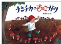
『ナミチカのきのこがり』 作/降矢 なな 出版社/童心社