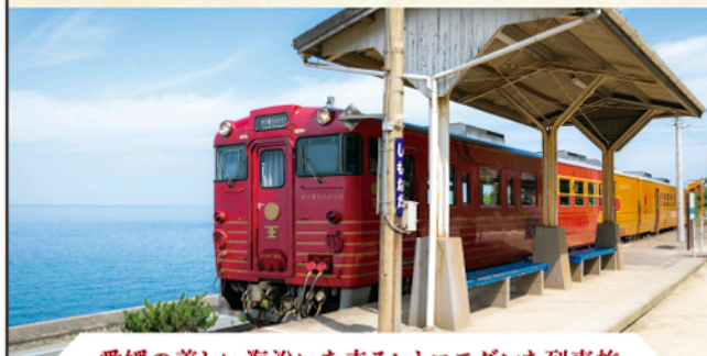
愛媛の美しい海沿いを走るレトロモダンな列車旅