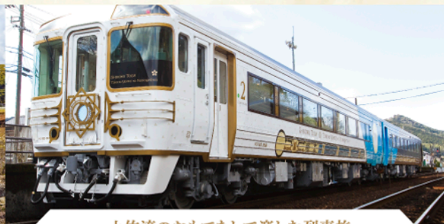
土佐流のおもてなしで楽しむ列車旅

公式WEBサイト https://www.jr-shikoku.co.jp/sennenmonogatari/ 「駅長推薦あじな散歩道 四国まんなか千年ものがたりきっぷ」の詳細はこちら ▶▶▶▶