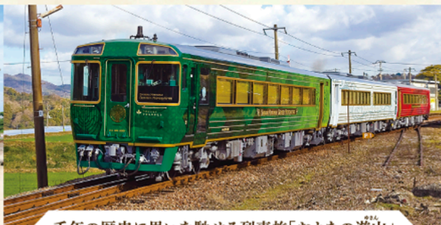
千年の歴史に思いを馳せる列車旅「おとなの遊山」

公式WEBサイト https://iyonadamonogatari.com/ 「駅長推薦あじな散歩道 伊予灘ものがたりきっぷ」の詳細はこちら ▶▶▶▶