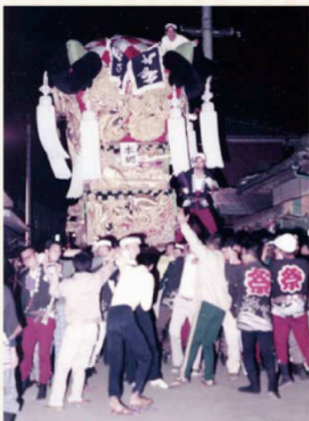
昭和49年 本郷太鼓台