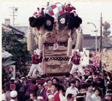
昭和49年 松神子太鼓台

市役所や図書館の写真、読者さんからの投稿写真を一挙ご紹介!“懐かしい”写真をたくさん集めました。