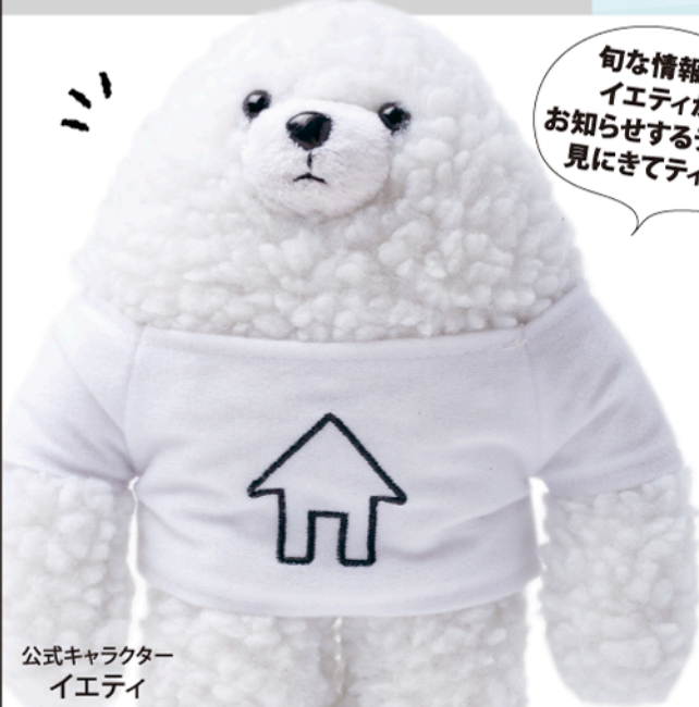
公式キャラクター イエティ