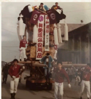
昭和45年 中須賀倉庫前