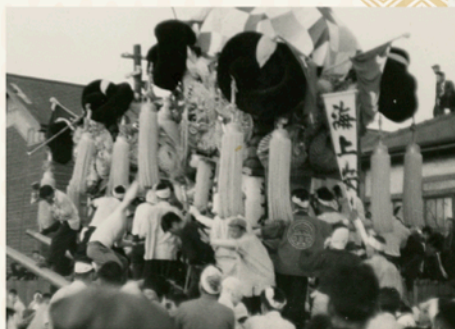
昭和初期~中頃 大江