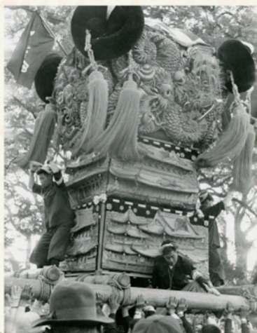
昭和初期~中頃 久保田