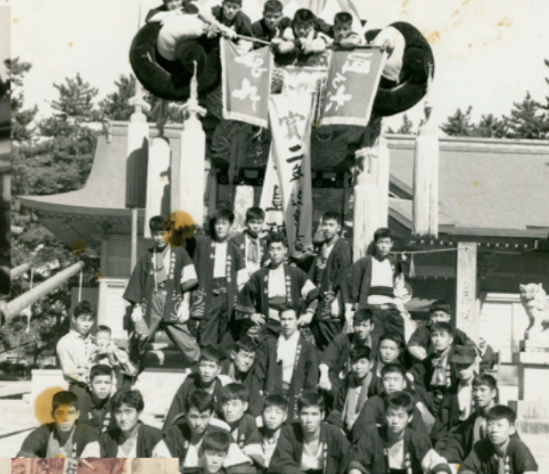
昭和初期 八幡神社