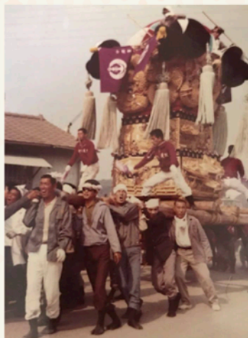
昭和44年 中須賀倉庫前