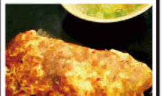
明石焼タコロール