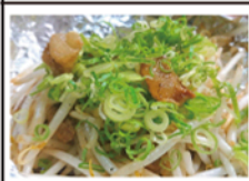
油かすもやし炒め