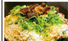
スジこんネギ焼き