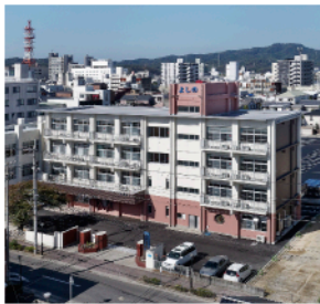
▲サービス付き高齢者向け住宅よしの

療に介護が加わらなければ患者さんは安心できない」と平成の初め頃から介護分野にいち早く着手。平成2年には介護老人保健施設「燧園」を開設し、患者さんのニーズに合わせた介護施設・在宅系サービスを多数提供しています。