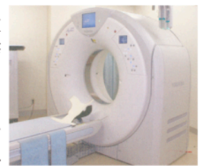
▲マルチスライスヘリカルCTスキャナ