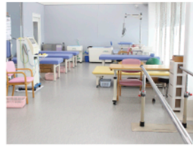
▲広々としたリハビリ室

新しい施設となります。デイケアを行う室内を広くとり、今まで以上にたくさんの方の利用者さんの対応をゆつたり行えるようになります。 施設では、自立した日常を営めるように、一人一人に合った介護サービスを提供し、家庭復帰できるように支援しています。在宅医療にも力を入れており、往診などの体制も整えています。