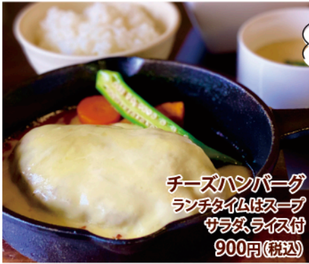
チーズハンバーグ ランチタイムはスープ サラダライス付 900円(税込)