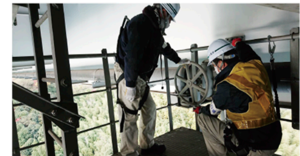
▲来島大橋の橋の下に通した送水管は点検し、管理を徹底