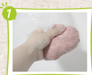
ポリ袋にひき肉、パン粉、牛乳、塩を入れてよくこねる。