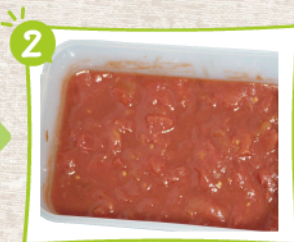
耐熱容器にトマト缶、ケチャップ、ソースを入れてよく混ぜる。