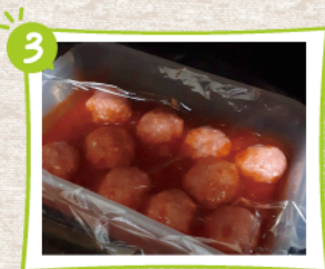
②に丸めた①を入れ、ふんわりとラップをし、600Wのレンジで約3分加熱する。