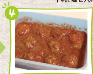
③の加熱後、裏返して約2分加熱する。