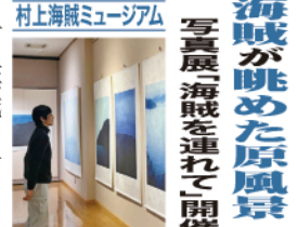
写真展「海賊を連れて開催」