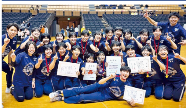
▲全国大会に出場した選手ら

ジャパネット杯春の高校バレー第76回全日本バレーボール高等学校選手権大会が1月4日から東京体育館で開