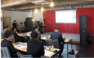
▲農業や漁業、観光などの分野で様々なプレゼンが展開

新たな価値をつくり出す新規事業者を発掘する「今治スタートアップビジネスプランコンテストSTARB OARD」最終発表会が先ごろ、スナバコ今治(常盤町4)で開催されました。審査を勝ち抜いた4組によるプレゼンが行われました。