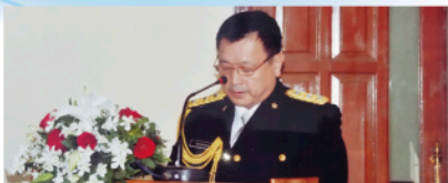
▲プカシ市警察署のプロジェクト開始7周年記念日行事で

1956年11月17日生まれ、新居浜市出身。愛媛大学工学部卒。1979年、警察官拝命。2013年、松山西警察署長。2015年、県警本部警備部長。現行政書士。妻と1女2男。趣味は料理。血液型B型。