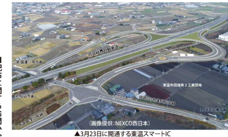
▲3月23日に開通する東温スマートIC