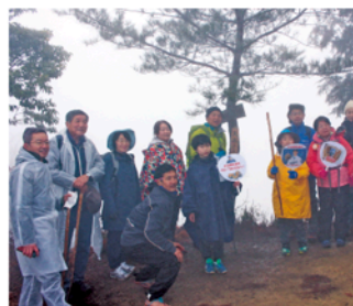
▲雨の中、山頂で大谷選手へ感謝を伝える参加者ら