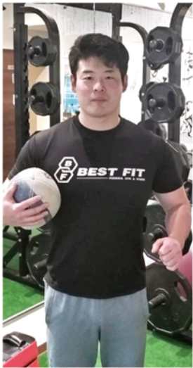
夢はプロの専属トレーナー