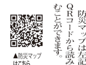
▲防災マップはこちら

の一覧表や、災害時の一人ひとりの防災行動計画「マイ・タイムライン」なども追加されています。このマップは、市民に確認してほしい情報