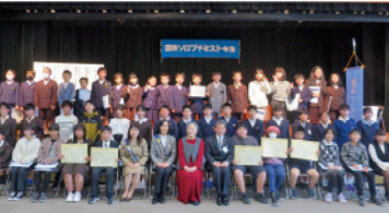
▲入選した小学生ら

「リハビリ入院」という言葉は初めて聞きました。通院でのリハビリも可能なんですか？