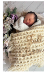
ベビーフォトスポットもあり

入院中は週2回、シエフが作るお楽しみ膳が好評です。産前、産後の乳房相談、小児科医による1ヶ月検診など1人ひとりに合った指導を心がけています。