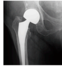
骨のレントゲン写真

生などの若い患者さんに対して怪我の予防やパフォーマンス向上を目指したりハビリを行います。令和5年4月からは婦人科の子宮がん検診などもスタートし、令和7年度から子宮頸がんワクチンも始めます。