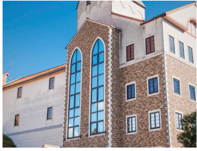
25周年を迎えるタオル美術館