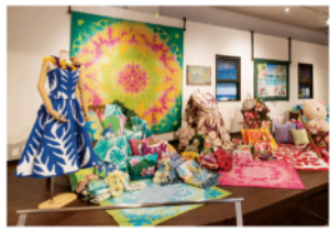
▲様々な企画展を開催

アートや自然、豊かな時間をあたたかく迎えるタオル美術館(朝倉上)が、今月開館25周年を迎えます。これまで多彩な企画展を開催し、訪れるたびに新たなアート作品との出会い、また四季折々の植物を楽しめる癒しのガーデンを提供してきました。