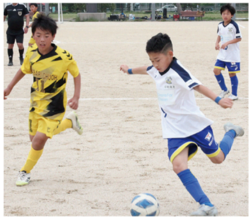
▲ 決勝はFC今治U-12 VS 今治中央FC