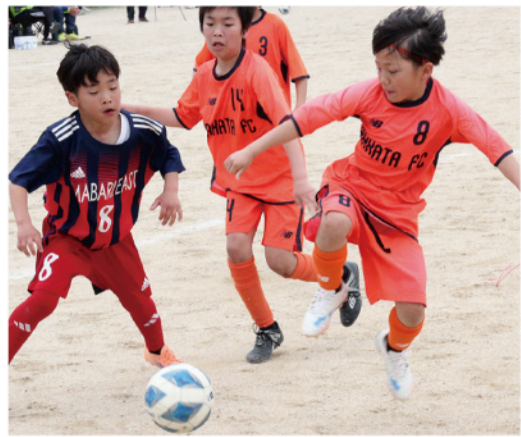
▲ 3位決定戦は伯方FC VS 立花教室

今後の目標は、ワンタッチの精度を高め、判断力のある選手になることです。これから練習に励み、失点を減らしていきたい。みんなでもっと良いチームにしていきたい」と笑顔で話しています。